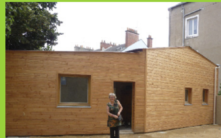
Bab'El Ouest – juin 2010