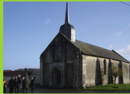
Visite de la Chapelle de Fréigné à Touvois le 3/12/2009