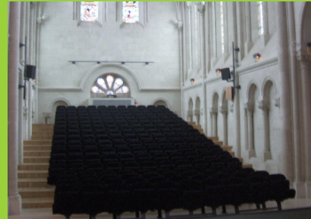
Chapelle Saint Louis à Cholet – vue sur les gradins dans le chœur