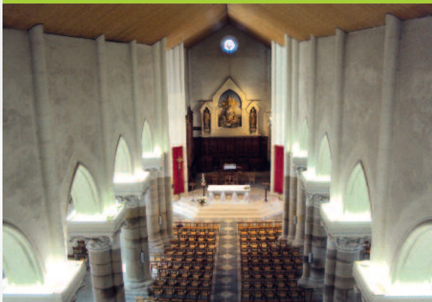
Eglise de Notre-Dame-de-Bon-Port, Bourgneuf-en-Retz.