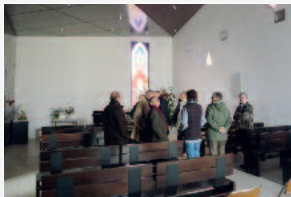
Nouvelle église (intérieur).

L'Église St-Georges , construite en 1870, a été détruite en 2006. Elle a été remplacée par une église plus petite. La reconstruction est apparue moins chère que la rénovation de l'église. De ce fait, elle conserve son statut d'église d'avant 1905.