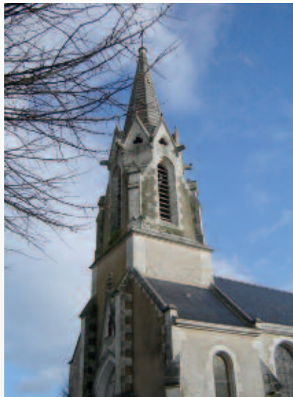
Église de Fresnay-en-Retz appartenant à la paroisse Sainte-Croix-en-Retz.

La grandeur des églises permet des rassemblements importants tant par leur capacité d'accueil de nombreux participants que pour l'expression des mouvements et démarches liturgiques. (Outre la difficulté de prévoir les réservations et l'aménagement ad hoc pour les rites, les salles polyvalentes ne pourraient contenir de telles assemblées).