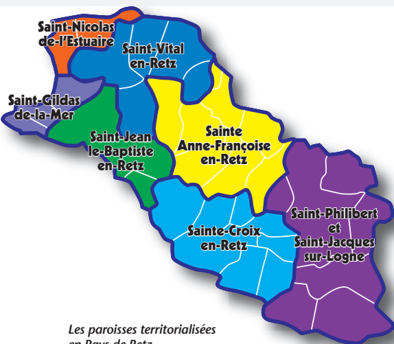
Les paroisses territorialisées en Pays de Retz.