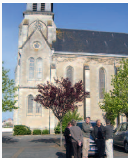
Église de la Marne.

« La République ne reconnaît, ne subventionne aucun culte », mais garantit le libre exercice des cultes. Elle met donc fin au service public des cultes reconnus et substitue aux établissements de cultes des personnes morales: associations cultuelles statut loi 1901.