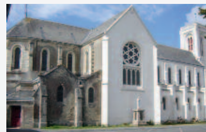
Église de Saint-Colomban.

Puis de 2008 à 2010, ont été engagés deux tranches de travaux portant sur la réfection, le changement de pierres de tuffeau et sur les couvertures