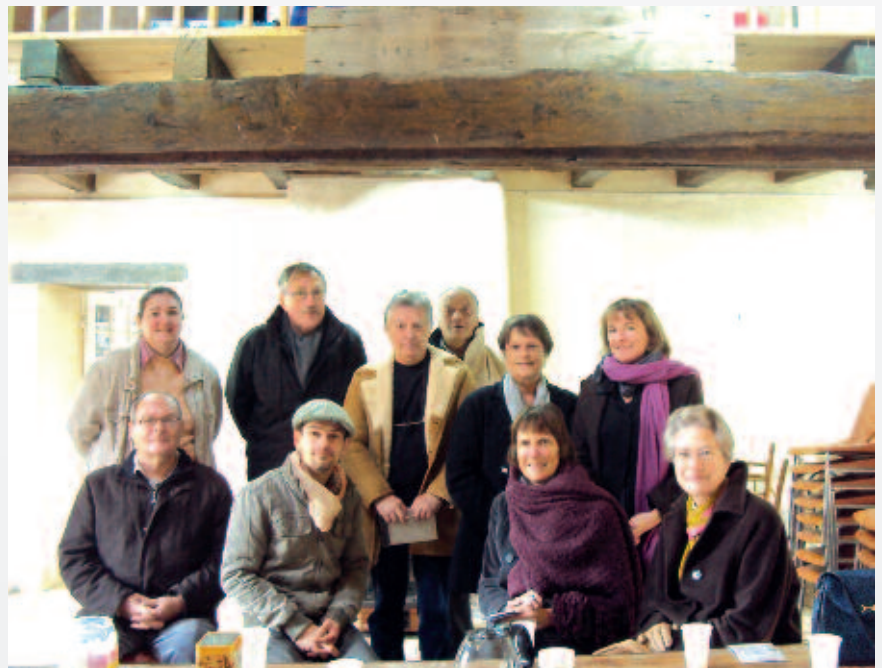
Visite à Nozay (24 novembre 2010).