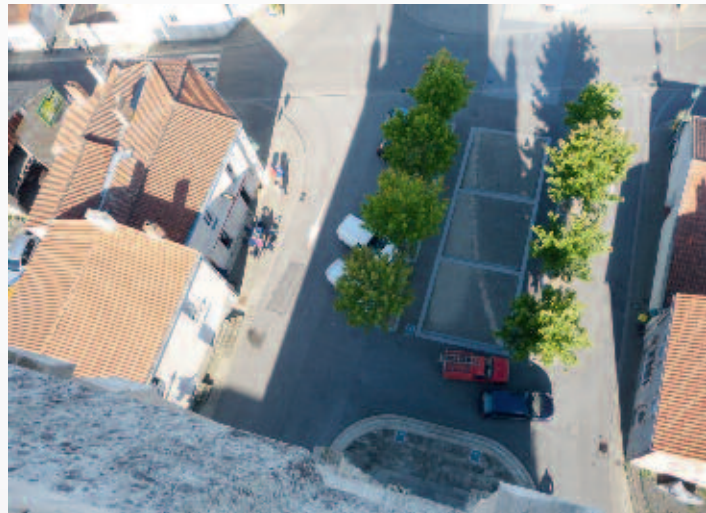
Vue du clocher de Saint-Lumine-de-Coutais.

commerces de proximité, l'étalement urbain et la construction de nouveaux équipements publics, les déplacements automobiles ont des conséquences sur cette fonction urbaine centrale sans pour autant anéantir totalement le pouvoir de centralité originel qui s'inscrit encore dans la trame viaire et par la monumentalité de l'édifice religieux.