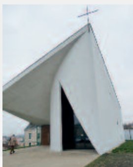
Nouvelle église (extérieur).