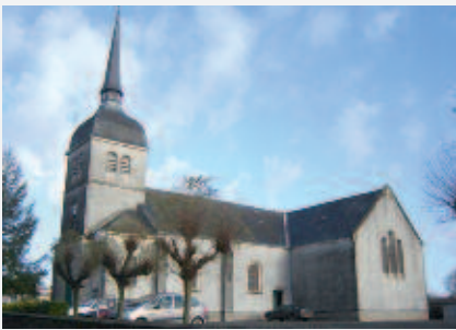
Touvois: l'église à proximité du centre.